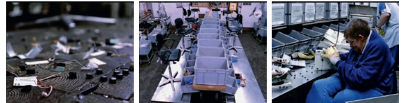
Arbeit am Ende

Koolhaas: ‘Dat komt vooral door die Aronofsky-films: Pi, Requiem for a Dream en The Fountain. In die laatste zit mij te veel muziek. Het is ondergedompeld in Mansells soundtrack zodat het niet langer functioneel is. Zo wordt het eigenlijk één lange videoclip.’